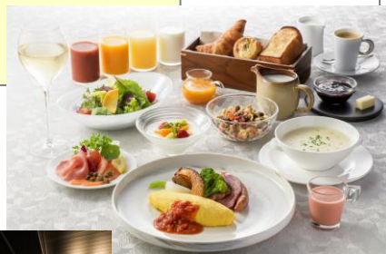
タテルヨシノでの朝食（イメージ）